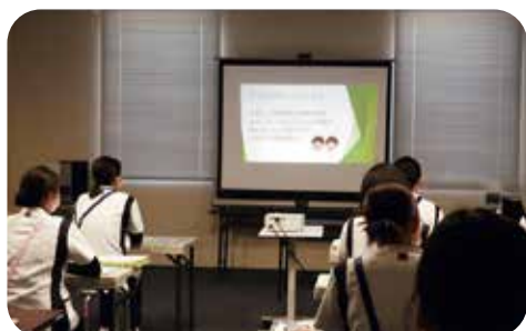
各部署ごとに分かれて説明を聞きます