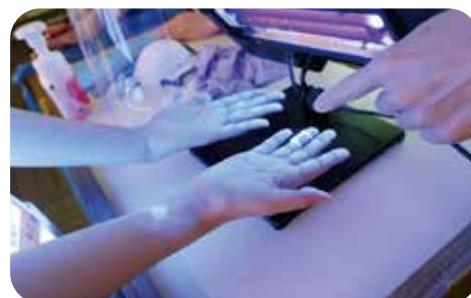
洗い残しをチェック!絆創膏のところが!!