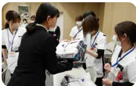
新品のユニホームを受け取ったら、午後は早速ユニホームでオリエンテーションを受けます!