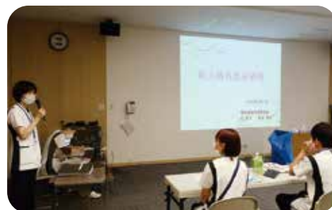
緊張感漂う感染対策の研修です